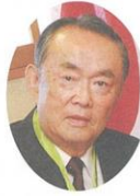
衆議院議員 夫 赴 平沼