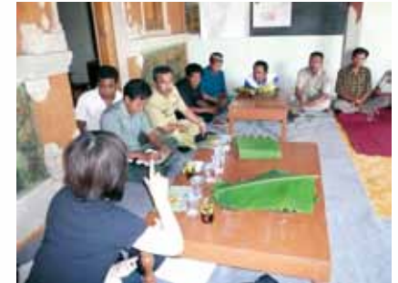
(一般社団)あいあいネット「インドネシア・西部バリ国立公園における地域コミュニティとの共存・協働関係構築プロジェクト」