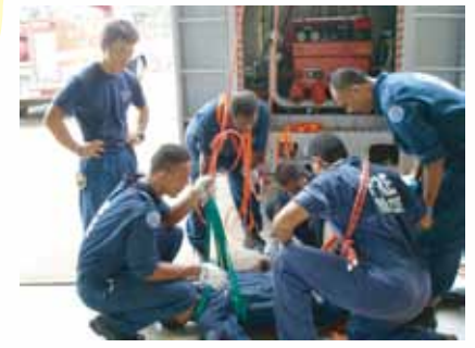
松阪地区広域消防組合(三重県)「フィジー・水難救助技術研修」