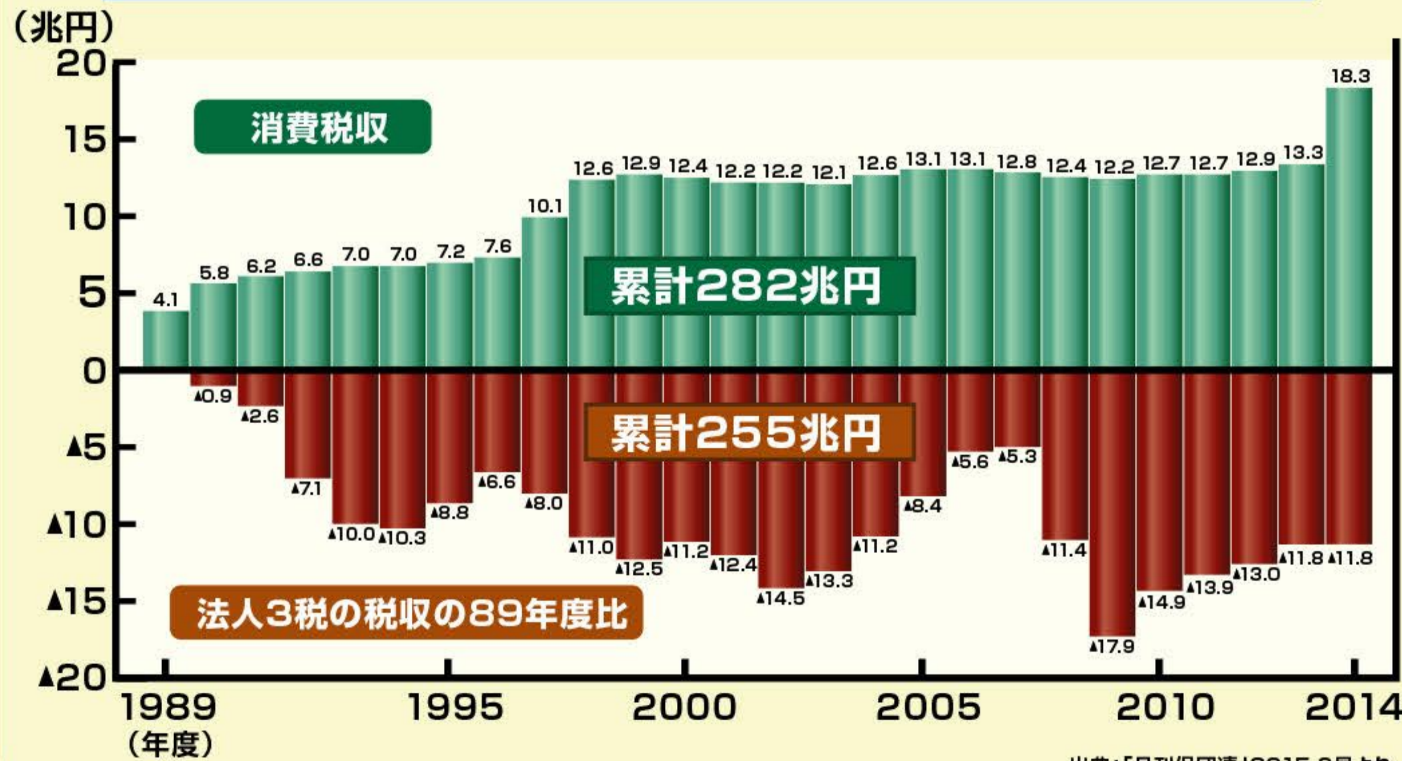
表3 消費税収入と法人3税の減収額の推移