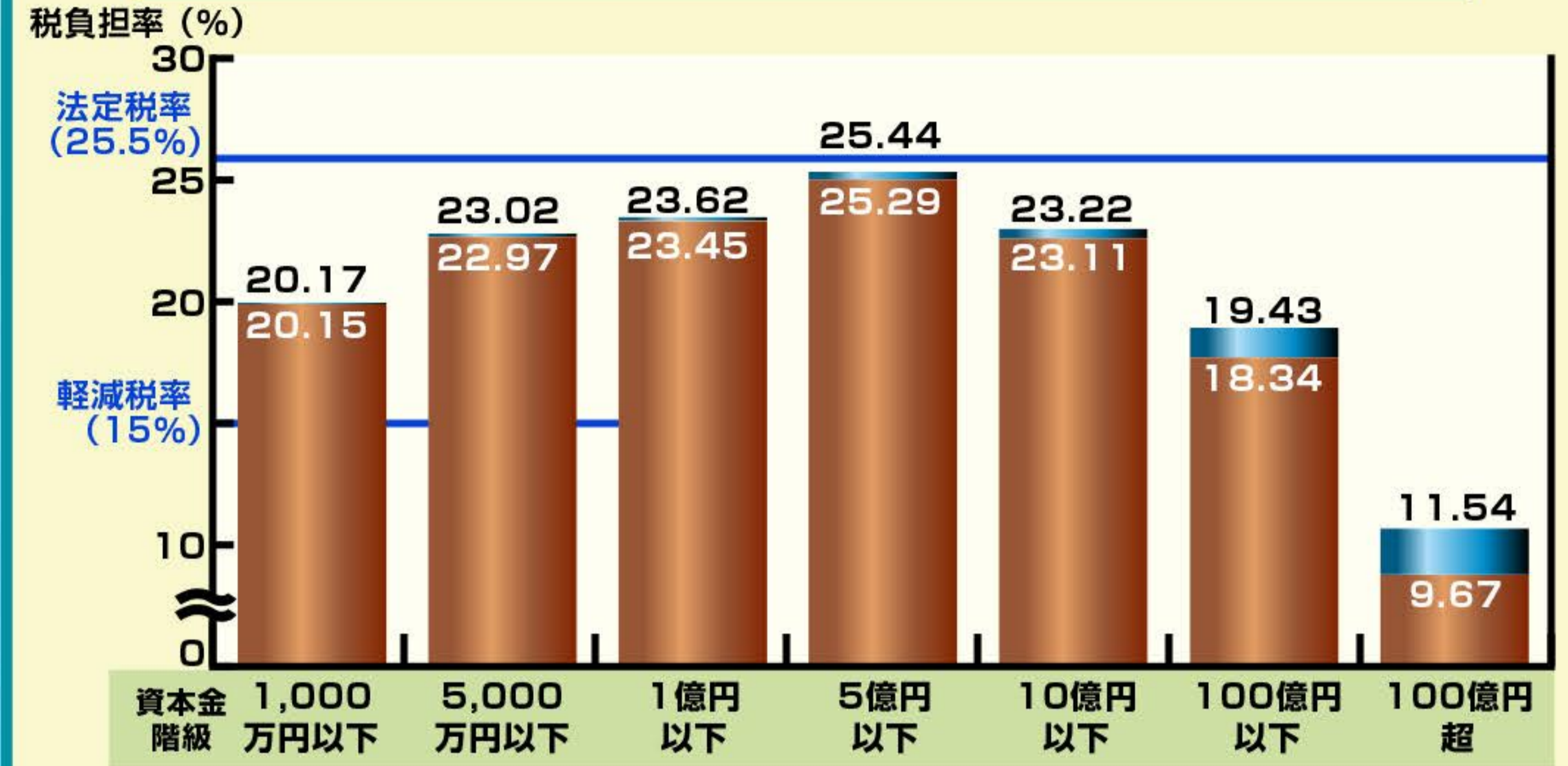
表2 資本金階級別法人税平均実効負担率 (2012年分)